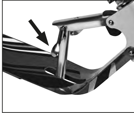
Abb. | Picture | Fig. | fig. | ill. | afb. 2