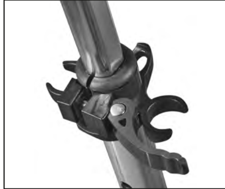
Abb. | Picture | Fig. | fig. | ill. | afb. 5