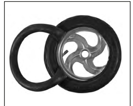
Abb. | Picture | Fig. | fig. | ill. | afb. 9