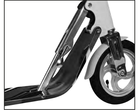
Abb. | Picture | Fig. | fig. | ill. | afb. 3