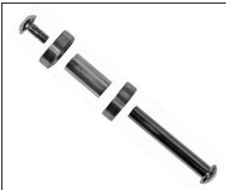
Abb. | Picture | Fig. | fig. | ill. | afb. 7