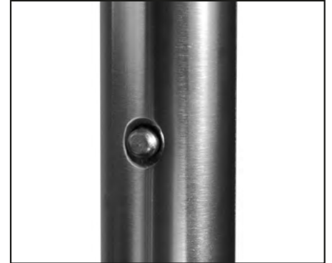
Abb. | Picture | Fig. | fig. | ill. | afb. 6