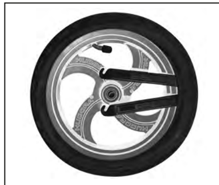
Abb. | Picture | Fig. | fig. | ill. | afb. 8