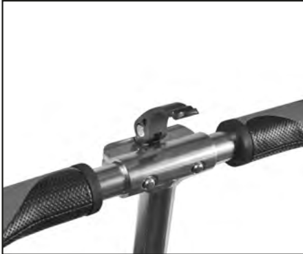
Abb. | Picture | Fig. | fig. | ill. | afb. 4